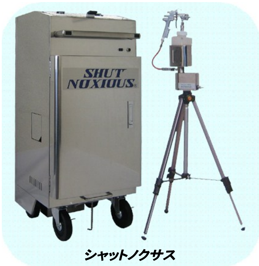
シャットノクサス