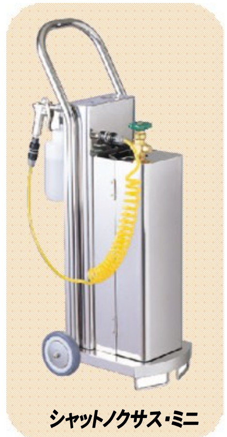
シャットノクサス・ミニ