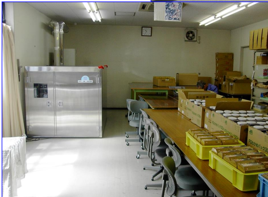
☆燦マットレス 抗菌・消臭乾燥機 MC-L L