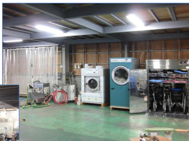
洗浄後の車椅子を次々と乾燥 燦マルチドライヤー多目的高速乾燥機