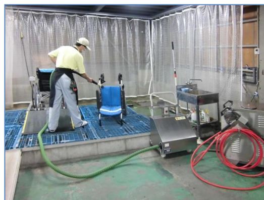
水切りでタオル不要、乾燥時間を半減 燦エアブローア低圧大風量送風機