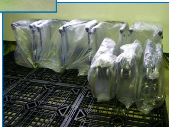
☆消毒済商品保管スペース☆