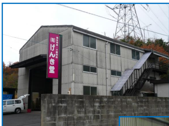
☆配送センター全景☆

昨年9月に東京ビッグサイトで開催されましたH. C. R. 2010 にご来場の際、新発売の「サンS-3 マットレス乾燥機」を現認いた だき、ご採用を決めていただきました。1号機の納入となりました。 島根県八束郡にある配送センター内に設置しました。