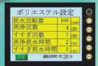
컬러 액정 터치패널