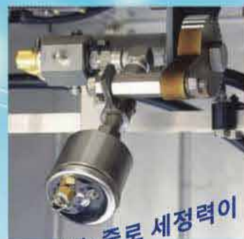
특수노즐로 세정력이 뛰어납니다.