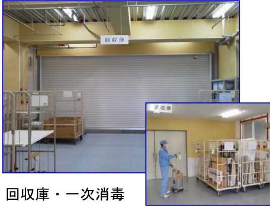
回収庫・一次消毒