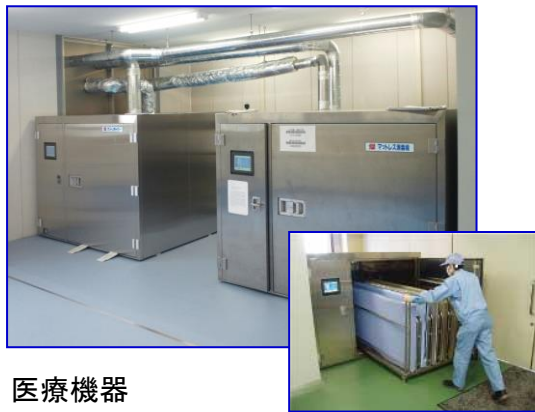
医療機器 「燦クリーンキーパー」による マットレスの蒸気消毒 及び 乾燥