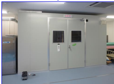
医療機器「OP-10」による ベッドのオゾン消毒